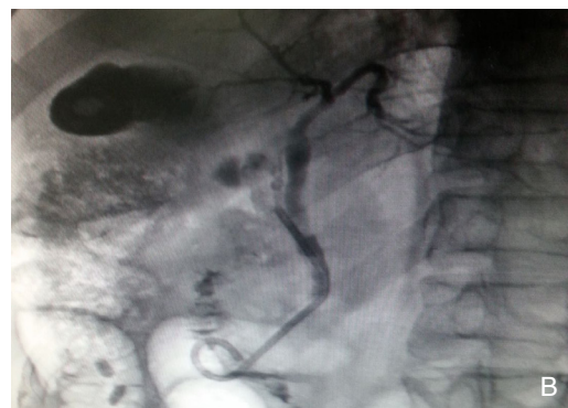
图2 术中图片 A: 支架置入后内镜像; B: C/S-J型胆道内支架X线检查